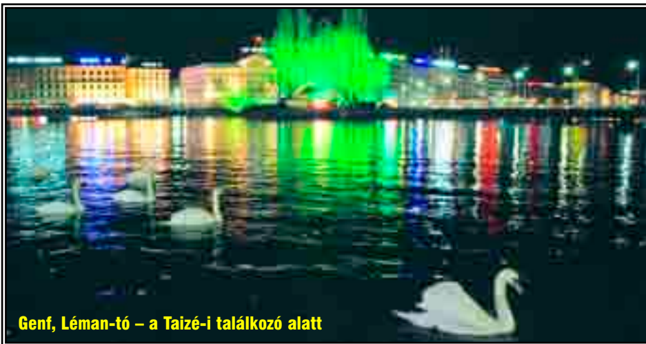
Genf, Léman-tó – a Taizé-i találkozó alatt

Vicc — Egy idős székelly házaspár ül csendben a házuk előtti kispadon. A férj egyszer kiveszi a pipát a szájából, és megszólal: Asszony, ha egyszer valamelyikünk meghal, én beköltözöm a városba. Miki svd