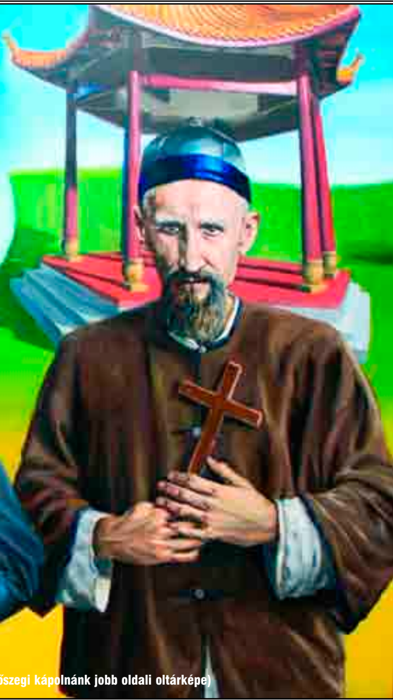
Őszegi kápolnánk jobb oldali oltárképe)