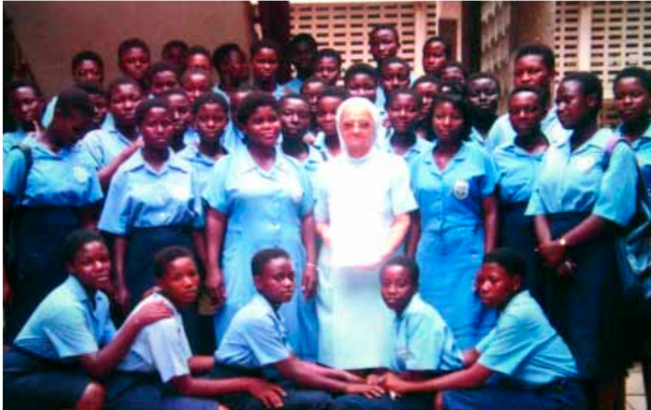
Búcsuzás az Egyetemista Szövetség tagjaitól: Accra, 1998.

Addig nem igazán ismertem szerzeteseket közelebbről, ezért minden új volt a számomra. Beilleszkedésemet segítette jó alkalmazkodó képességem,