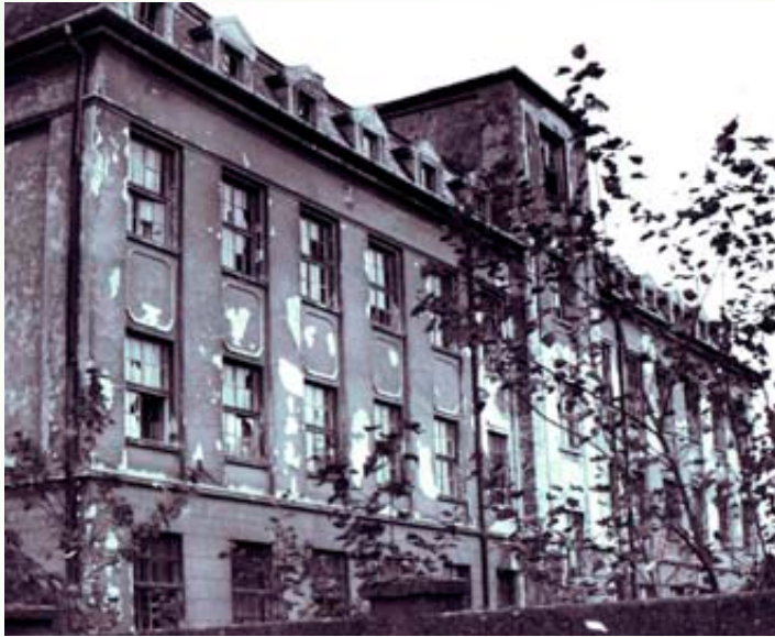
A missziósház a határórség kivonulása után (1970-es évek)

pontosan rekonstruálhassuk, hány misszionárius atya és testvér került ki az intézmény falai közül hosszabb-rövidebb képzés után, hogy Magyarországon vagy a világ távo-